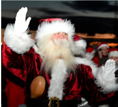
Den 22. november ankommer julemanden til Kanalbyen.

Julemandens ankomst til Gl. Havn Fredag den 22. november kl. 16.30 spiller 6. Juli Garden på Gl. Havn, mens vi venter på, at Julemanden ankommer med skib.