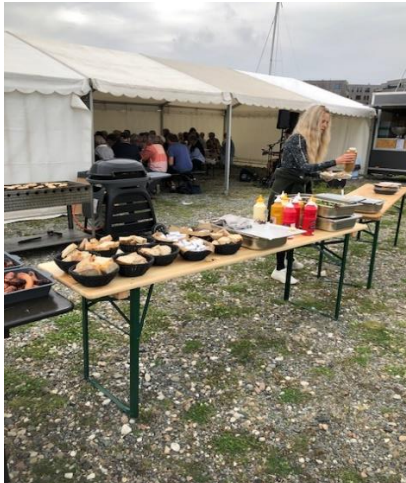
Der var rigeligt med god mad og drikke, og inde i teltet gik snakken på tværs lige fra startet. Det tyder på, at vi er ved at få et godt nabo- og fællesskab i Kanalbyen.