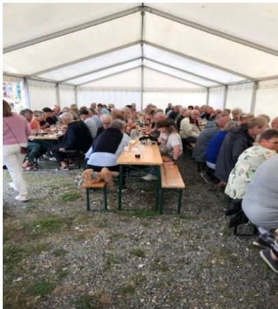
Vejret var med os i år, men for en sikkerheds skyld var der opstillet et telt til de knap 120 deltagere.